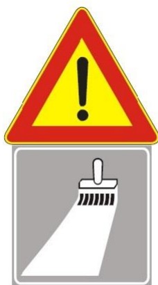
Figura II 391 Art. 31