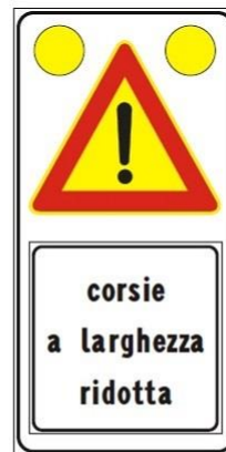
Figura II 391c Art. 31